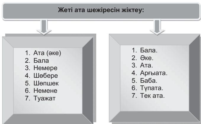
1-сурет. Жеті ата шежіресінің жіктеу үлгісі

Мәшһүр Жүсіп Көпейұлы «Қазақ шежіресі» деген еңбегін және интернет көздерінде берілген ақпараттарға сүйене отырып біз «Жеті атаны жіктеудің» екі нұсқасы бар екендігін байқауға болады ( 1-сурет ).