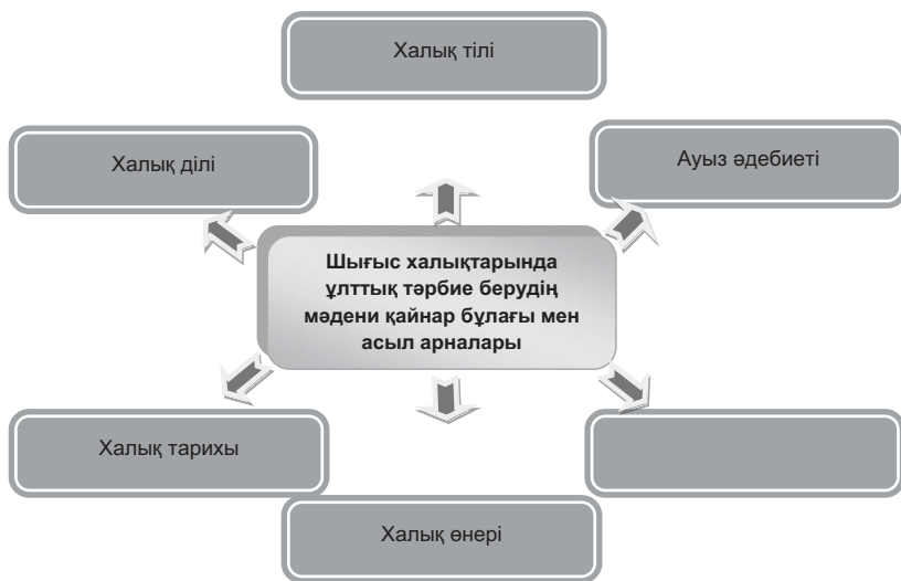
3-сурет. Шығыс халықтарында балаға ұлттық тәрбие беру арналары