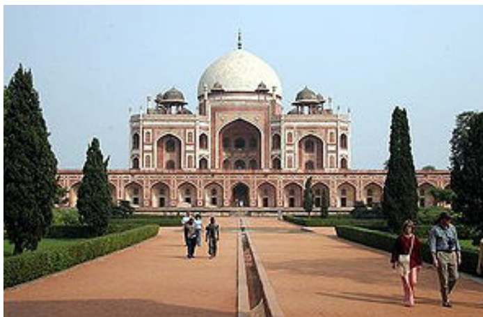
Делһи Һұмаюн патшаның кесенесі

Нәсиреддин Һұмаюн – Бабыр құрған патшалықтың екінші патшасы, Зәһиреддин Мұхаммед Бабырдың ұлы. Ауғанстанның Кабул қаласында дүниеге келіп, қырық сегіз жасында Үндістанның астанасы болған Делһи қаласында қайтыс болып, сонда жерленді.