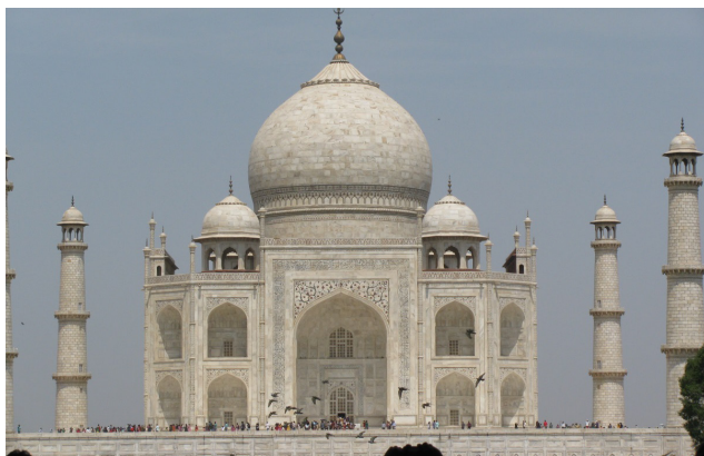
Тәж-Маһал кесенесі. Үндістан, Агра