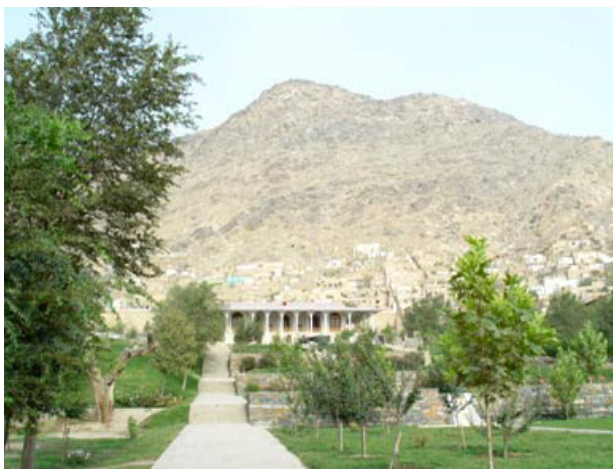
Кабулдағы Бабыр бағы

Зәһиреддин Бабыр аласапыран саяси тартыстың ортасында жүріп, талай белесті бағындырып, 1530 жылы желтоқсанның 26-сы күні, небәрі 48 жасында Агра қаласында дүние салды. Бірақ тағдырдың жазмышымен қазіргі Ауғанстан Ислам Республикасының астанасы Кабул қаласындағы «Бабыр бағы» деген саябақта жерленді.