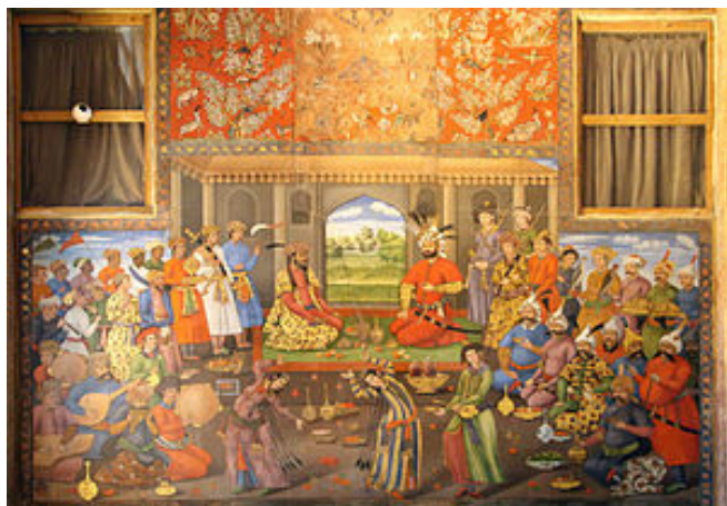
Ғұмаюн-шаһ Тәһмасп Сәфәви патшаның құзырында.

Бұл сурет Исфahan қаласындағы Чехел сүтун сарайының қабырғасына салынған