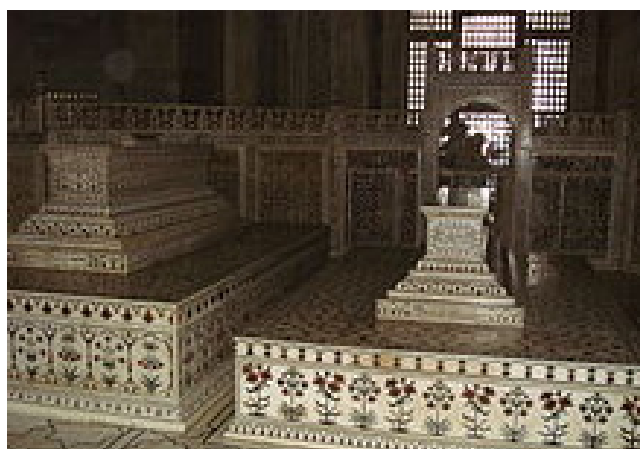
Екі ғашықтың: Шаһ Жаһан мен Тәж-Маһалдың қабірі. Тәж-Маһал кесенесі, Агра