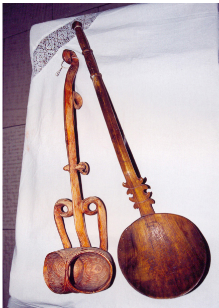
33-сурет. Ожау түрлері. Ағаш. XX ғ. басы. Семей қалалық өлкетану музейі, Семей қаласы