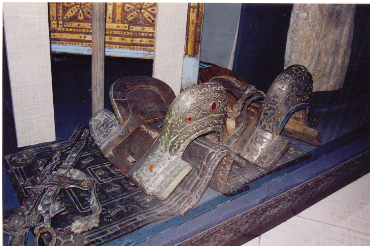
37-сурет. Ертоқым. Найман ер. Ағаш, күміс. XX ғ. басы. Семей қалалық өлкетану музейі, Семей қаласы