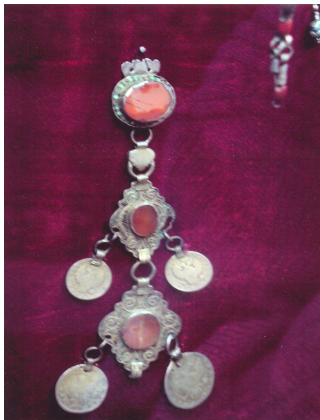
19-сурет. Шашбау. Күміс. ХІХ ғ. аяғы. Өскемен қалалық этнографиялық музейі, Өскемен қаласы