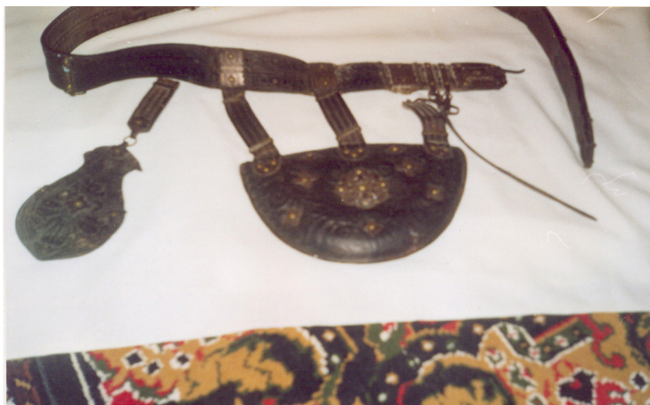
16-сурет. Кісе. Найман елінде тұңғыш қажылыққа барған шал қажы Дондағұлұлының кісесі. Тері, күміс. XIX ғ. аяғы. Тарбағатай ауданы, Қызыл кесік ауылындағы мешіттегі музей, Қызыл кесік ауылы