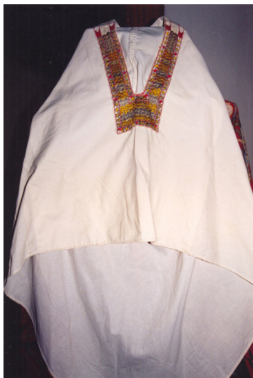
23-сурет. Кимешек. XX ғ. басы. Семей қалалық өлкетану музейі, Семей қаласы