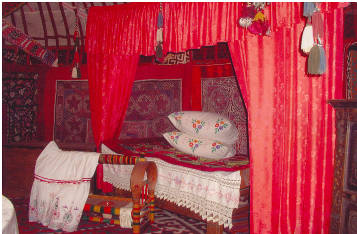
5-сурет. Киіз үйдің ішкі жабдықтары. XX ғ. басы. Өскемен қалалық этнографиялық музейі, Өскемен қаласы