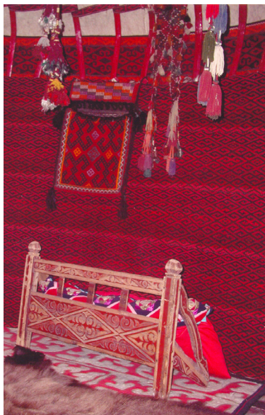
7-сурет. Жастық ағаш. Ағаш. XX ғ. аяғы. Өскемен қалалық этнографиялық музейі, Өскемен қаласы.