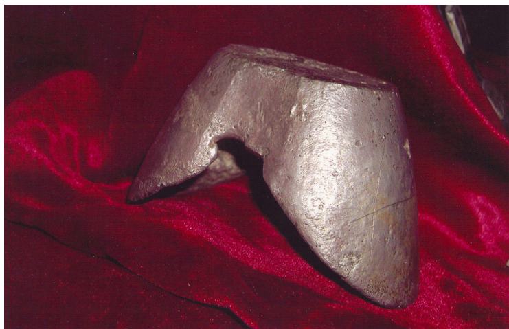
34-сурет. Жамбы. Тайтұяқ. Күміс. ХІХ ғ. аяғы. Өскемен қалалық этнографиялық музейі, Өскемен қаласы