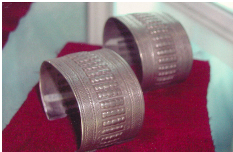
20-сурет. Білезік. Күміс. ХІХ ғ. аяғы – ХХ ғ. басы. Өскемен қалалық этнографиялық музейі, Өскемен қаласы