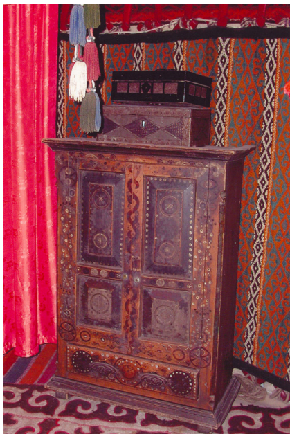
6-сурет. Асадал. Ағаш, сүйек. XIX ғ. аяғы. Өскемен қалалық этнографиялық музейі, Өскемен қаласы