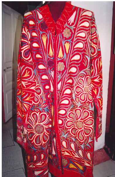
25-сурет. Шапан. XX ғ. басы. Семей қалалық өлкетану музейі, Семей қаласы