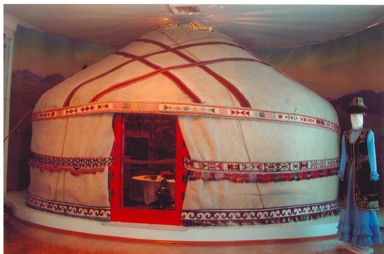
4-сурет. Киіз үй. ХХ ғ. ортасы. Өскемен қалалық этнографиялық музейі, Өскемен қаласы