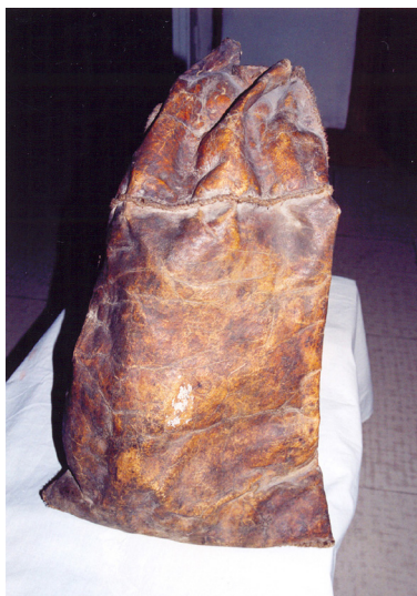
30-сурет. Саба. Тері. XIX ғ. аяғы. Семей қалалық өлкетану музейі, Семей қаласы