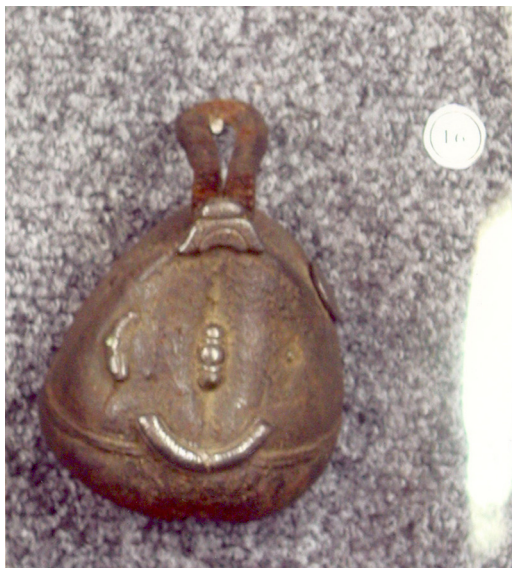
3-сурет. Томаға. Тері. ХІХ ғ. аяғы – ХХ ғ. басы. Өскемен қалалық этнографиялық музейі, Өскемен қаласы