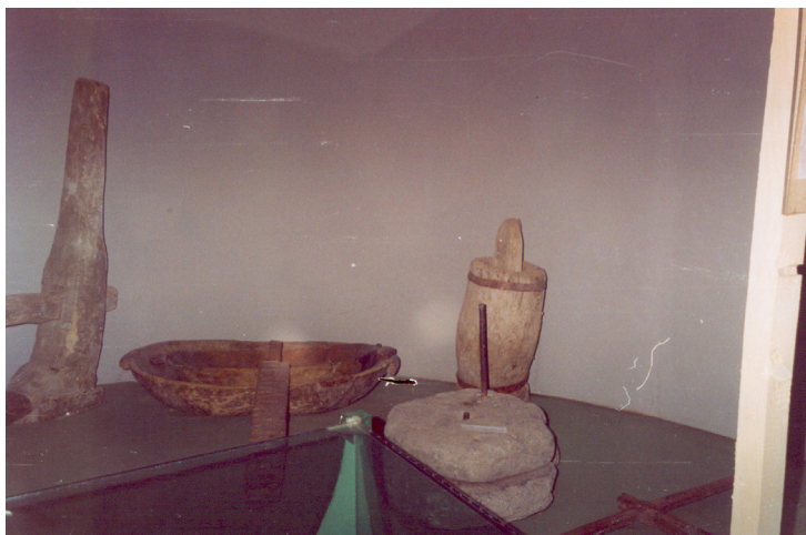
2-сурет. Келі, астау. Ағаш. XX ғ. басы. Тарбағатай аудандық өлкетану музейі, Ақсуат ауылы