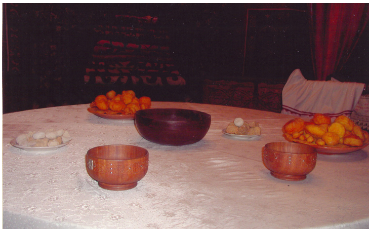
27-сурет. Ыдыстар. Ағаш. XX ғ. Өскемен қалалық этнографиялық музейі, Өскемен қаласы