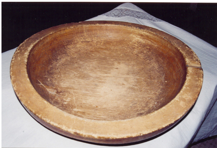
32-сурет. Табақ. Ағаш. XX ғ. басы. Семей қалалық өлкетану музейі, Семей қаласы