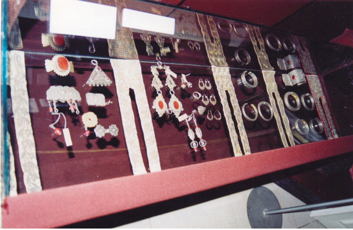
22-сурет. Әйелдің әшекей заттары. Күміс. XIX ғ. аяғы. – XX ғ. басы. Семей қалалық өлкетану музейі, Семей қаласы