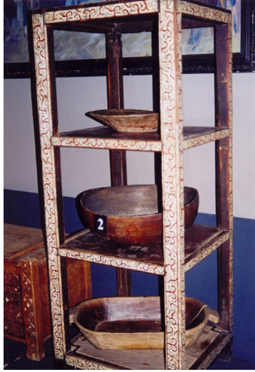
13-сурет. Этажерка. Ағаш, сүйек. XX ғ. басы. Семей қалалық өлкегану музейі, Семей қаласы