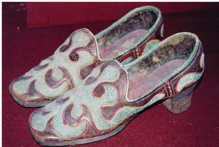
18-сурет. Әйел аяқ киімі. Тері. XIX ғ. аяғы. Семей қалалық өлкегану музейі, Семей қаласы