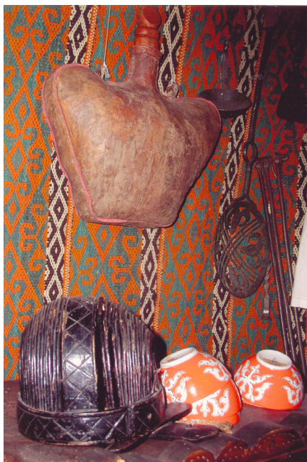
28-сурет. Кесеқап. Тері. XIX ғ. аяғы. Өскемен қалалық этнографиялық музейі, Өскемен қаласы