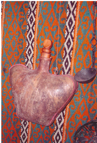
29-сурет. Торсық. Тері. XX ғ. басы. Өскемен қалалық этнографиялық музейі, Өскемен қаласы