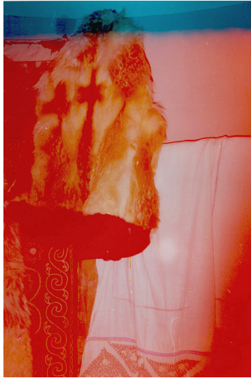
14-сурет. Түлкі ішік. XX ғ. басы. Тарбағатай аудандық өлкегану музейі, Ақсуат ауылы