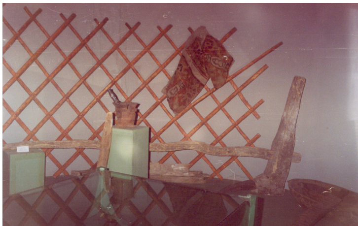
1-сурет. Соқа. Ағаш. XX ғ. басы. Тарбағатай аудандық өлкетану музейі, Ақсуат ауылы