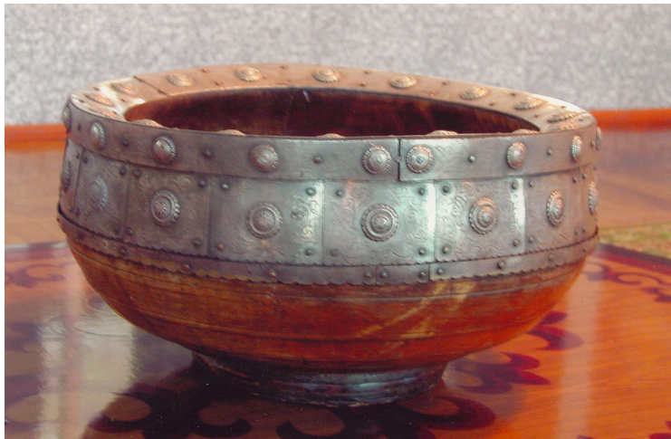
31-сурет. Шара. Ағаш, күміс. XX ғ. басы. Өскемен қалалық өлкетану музейі, Өскемен қаласы