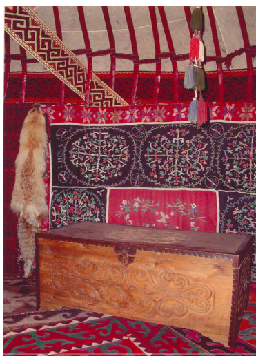
8-сурет. Сандық. Ағаш. XX ғ. басы. Өскемен қалалық этнографиялық музейі, Өскемен қаласы