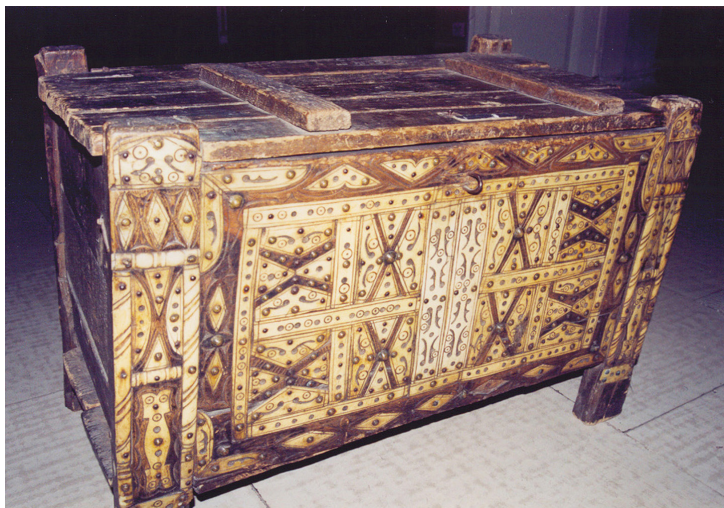
10-сурет. Сандық. Ағаш. XX ғ. басы. Семей қалалық өлкетану музейі, Семей қаласы