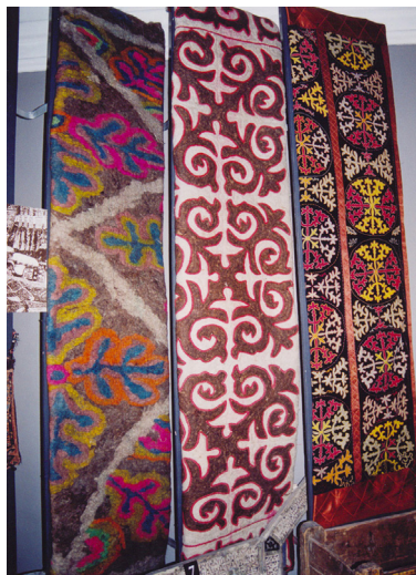
11-сурет. Текемет, сырмақ, түскиіз. XX ғ. Семей қалалық өлкегану музейі, Семей қаласы