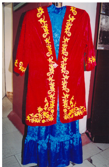
24-сурет. Әйел көйлегі мен шолақ жең қамзолы. XX ғ. Семей қалалық өлкетану музейі, Семей қаласы