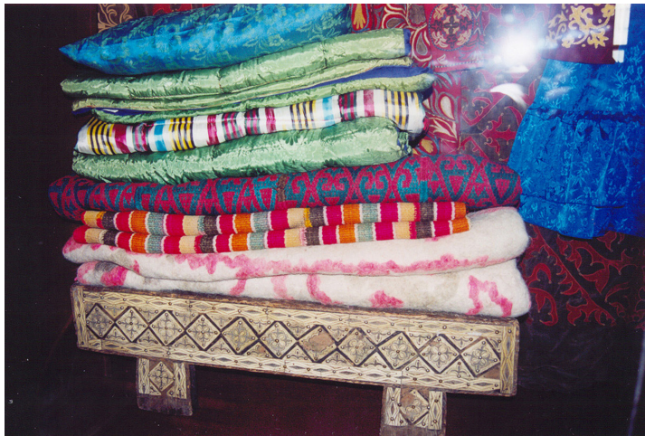
9-сурет. Жүк аяқ. Ағаш, сүйек. XX ғ. басы. Семей қалалық өлкетану музейі, Семей қаласы