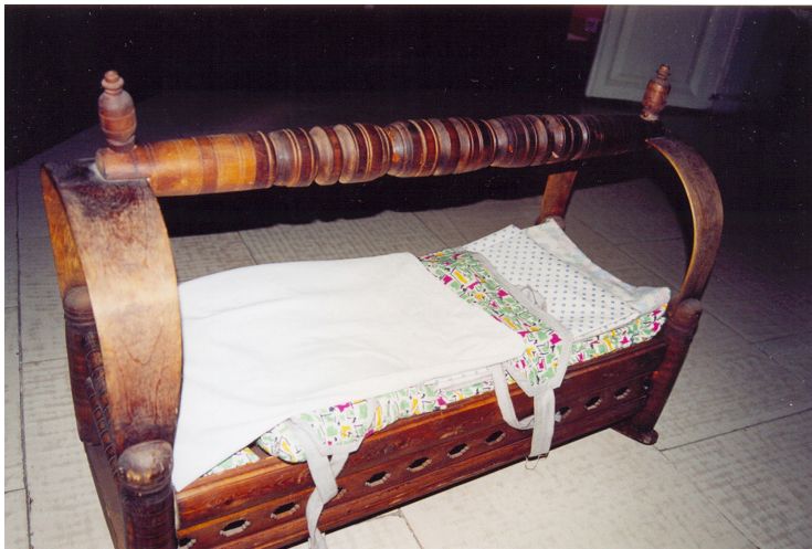
35-сурет. Бесік. Ағаш. XX ғ. басы. Семей қалалық өлкетану музейі, Семей қаласы