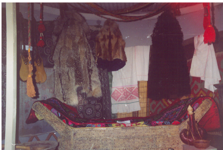
26-сурет. Ағаш төсек. Ағаш, сүйек. XX ғ. басы. Тарбағатай аудандық өлкетану музейі, Ақсуат ауылы