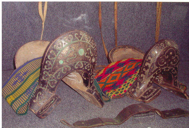
38-сурет. Ер тоқым. Ағаш күміс. XX ғ. басы. Өскемен қалалық этнографиялық музейі, Өскемен қаласы