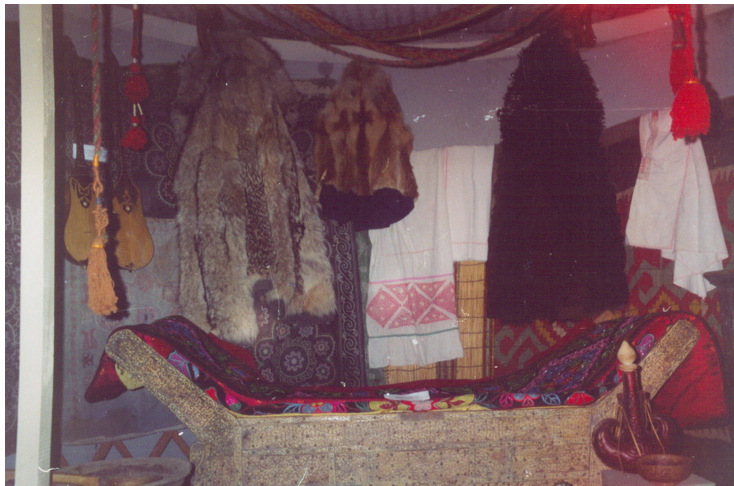
17-сурет. Ішік түрлері. XX ғ. басы. Тарбағатай аудандық өлкегану музейі, Ақсуат ауылы