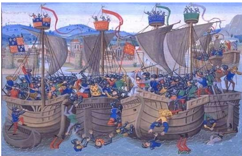
Слейсе түбіндегі шайқас. Ортағасырлық миниатюра

Соғыс ағылшындардың солтүстіктегі қимылдарымен басталды. Ағылшындар 1340 ж. Слейсе түбінде (Фландрия) француз флотын түгелдей жойып жіберді.