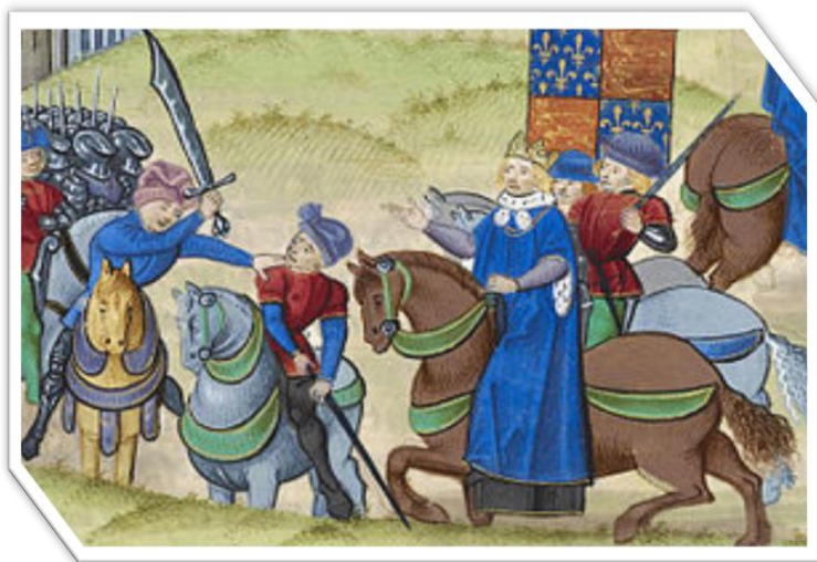
Уот Тайлердің өлтірілуі. Минатюра.

Алқызыл және ақ раушандар соғысы. Плантагенеттер әулетінің соңғы өкілі II Ричард 1399 жылы жақын туысы Генрих Ланкастердің төңкеріс жасауының нәтижесінде тақтан құлатылып ҮІ Генрих Ланкастер таққа отырды. Сөйтіп, Ланкастерлер әулетінің корольдық құруы басталды. Басқаның жерін жаулап алу соғысы жеңіліспен аяқталғаннан кейін ағылшын барондары Англиядағы жерлерді қайта бөлу үшін өз ара қырқысулар жүргізді. Ақсүйектер арасындағы соғысты халық екі раушанның соғысы деп атап кетті. Қызыл Раушан Ланкастерлер әулетінің белгісі, ақ раушан Иорк әулетінің белгісі болды. Екі әулеттің арасындағы соғыс ұзақ жүргізілді. 1485 жылдың 22 тамызындағы Босворт деген жердегі соғыста Ланкастерлер әулетінің туысы Генрих Тюдор жеңіске жетіп, ҮІІ Генрих деген атпен король болып жарияланды. Сонымен Англия тағына Тюдорлар әулеті келді (1485-1603 жж.) .