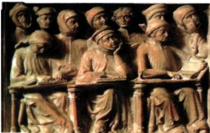
Дәріс тыңдап отырған студенттер. Барельеф. Италия. XIV ғ.

XIII ғ. Палермода, Салериода, Оксфордта университеттер құрылды. 1500 ж.бүкіл Еуропада 65 университет болды. Университеттердегі сабақтарда студенттер дәрістер тыңдап, оны жазып алып, отырыстарға қатысып отырды. Англияда Оксфорд университеті XIII ғасырда ашылды. Ал одан кейін іле-шала Англия каролі Генри III тұсында Кембридж университеті орта ғасырлық білім ордаларына айнала бастады. Мұндай жоғарғы оқу орындарында-дарынды ғалымдар, білікті мамандар еңбек етті. Солардың бірі-белгілі университет ғалымы, ағылшын Роджер Бэкон болды. Сол сияқты Оксфорд университетінде өз заманының алдыңғы қатарлы ғалымдары – Гросин, Линакр, Колет және тағы басқа ғалымдар жемісті еңбек етті