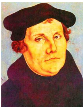
М. Лютер (1483-1546)

Шіркеудің қаулылары және папаның бұйрықтары діннің ақиқаты емес, діни ақиқаттың негізі қасиетті кітап (библия) леп көрсетті. Шіркеудің міндеті қасиетті кітаптың мәнін христиандарға түсіндіру деді. 1517ж. Лютер папаның индулгенциясын (күнәні кешіретін грамота) сатуға қарсы бағытталған 95 тезисін жариялады.