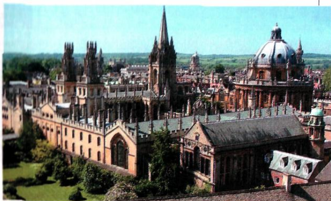
Оксфорд университеті. Англия.

Алғашқы 3 ғылым-тривиум, қалған 4-квадривиум деп аталды. Кейінірек еркін өнерлер жоғарғы оқу орындарына енгізіліп, олар негізінен төменгі факультеттерде оқытылды. Жоғарғы оқу орындары кейін университеттер деп аталатын болды.