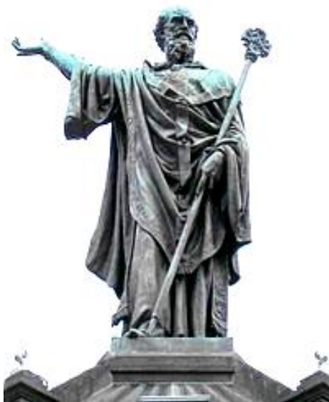
Клермондағы II Урбан ескерткіші

Жорыққа қатысушылардың арасында ұры қарақшыларда болды. Сондықтанда «құдайсыздардың» жеріне жетпей-ақ олар Рейн қалаларын, Венгрияны, Болгария жерінде де тонаушылықтар жүргізді. Кресшілер 1096ж. жазында Константинопольге жеткенде император оларды Кіші Азияға өткізіп жіберді.