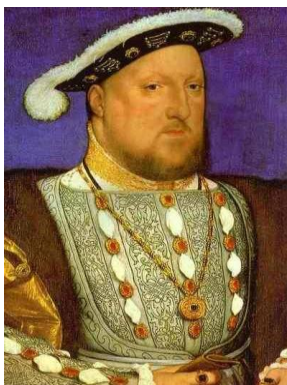
ҮІІІ Генрих Тюдор

Англияның саяси-әлеуметтік дамуы. 1485 жылдан 1603 ж. дейін Англияны Тюдорлар әулетінен шыққан корольдер биледі. Олар өздерінің өкіметін әжептәуір нығайтып, абсолютизм деңгейіне көтерді. Тюдорлар әулетін құрушы ҮІІ Генрих (1485-1509) және оның баласы ҮІІІ Генрих (1509-1547) елдегі король өкіметіне қарсы болған ірі феодалдармен аяусыз күрес жүргізді.