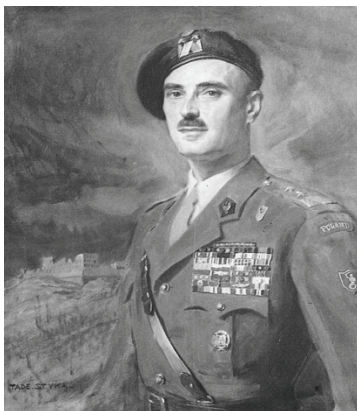
5-сурет. Генерал Владыслав Андерс (1892-1970 ж.)

Генерал В. Сикорский Кеңес Одағында жасақталатын поляк армиясының қолбасшылығына генерал-лейтенант Владыслав Андерсті тағайындады. Кеңес Одағындағы поляк әскерінің тарихы жайлы сөз қозғағанда көп жағдайда «Андерс әскері» деген атпен береді. Андерс әскерінің тарихы екінші дүниежүзілік соғыс жылдарындағы кеңес-поляк қатынастарының соңғы жылдарда зерттеле бастаған аспектілерінің бірі болып табылады. Владыслав Андерс 1892 жылы дүниеге келген. Ригадағы политехникалық институтта оқып жүрген кезінде әскерге шақырылған. Бірінші дүниежүзілік соғыста Ресей әскері қатарындағы поручик шенінде атты әскер эскадронын басқарған. Оның әскери білімі өте жоғары, Петербургтегі Әскери академияны және Париждегі Жоғарғы қолбасшылар мектебін бітірген. 1920 жылғы кеңес-поляк соғысында 15-Познань полкын басқарған. Одан кейін Польша мемлекеті әскерінің штаб бастығы болған. Екінші дүниежүзілік соғыс басталғанда В. Андерс басқарған атты әскер бригадасы Польшаға басып кірген кеңес әскеріне қарулы қарсылық көрсеткен [9, 99 б.]. Ауыр жараланған генерал тұтқынға түсіп, кеңес түрмесінде болды.