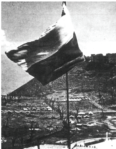
7-сурет. Монте-Кассино биіктігіндегі Польша жалауы

Италияның Монте-Кассино асуында Польша жалауы желбіреуде.