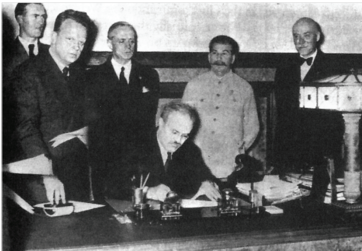
2-сурет. Риббентроп-Молотов пактісіне қол қойып жатыр

алған жерлерімен көрші болды. Ежелгі Речь Посполитая жері тарихта үшінші рет бөліске түсіп, поляк халқы тәуелсіздігінен айырылды.