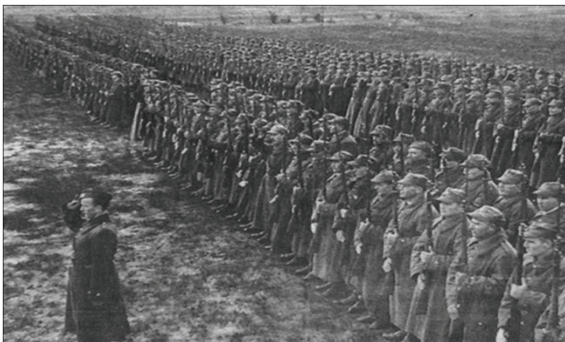
4-сурет. 1942 жылы КСРО жерінде құрылған поляк әскері

Поляк әскерін құрудың жеке мәселелерін талқылады. Кеңес-поляк аралас комиссиясының 16 тамыздағы отырысында поляк әскерін құрудың принциптері мен мерзімі, құрамдардың саны, қару-жарақпен және жабдықтармен қамтамасыз ету, азық-түлік және қаржыландыру мәселелері жан-жақты талқылады. Генерал Андерс үшін ең бастысы Кеңес Одағы жеріндегі лагерьлер мен түрмелерде отырған поляк офицерлері мен жауынгерлерін босатып алу болды, олар әскердің негізгі күшін құрауға тиісті еді [12, 319, 356 б.].