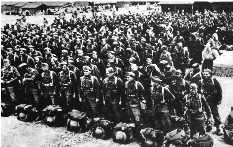
6-сурет. 1942 жылы поляк әскері КСРО жерінен Иранға аттануы

1944 жылы қаңтар айында одақтас әскерлерімен поляктар Рим қаласының маңындағы Монте-Кассиноны алу үшін шайқасқа қатысты. Бұл бекіністі алу үшін Польша жауынгерлері айтарлықтай ерлікпен соғыс қимылдарын жүргізді. Бұл шайқас мамыр айының 2-күні болды.