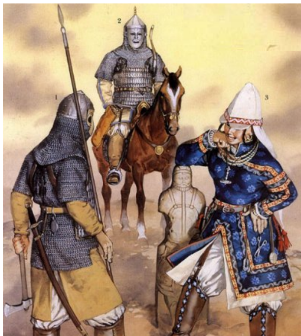
1 – Еділ Бұлғар жауынгері, 2 – Қыпшақ атты әскері, 3 – Печенег жаяу әскері

Печенегтердің византиялық алтын мен сән-салтанат заттарына мұқтаждығы оларды рустар, венгрлер және болгарларға қарсы шығатын тамаша одақтас ететін. Болгар патшасы Симеон да Византияға қарсы осындай одақтас құрғысы келіп, бірақ ол ойы іске аспайды. 1018 жылы император II Василий (976–1025) Бірінші Болгар патшалығын құлатып, бос жерлерге көшіп келген печенегтер енді империяның тікелей көршілері болады.