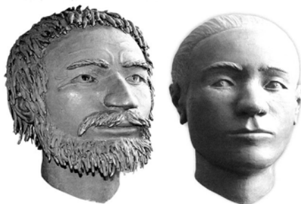
Бұлғар қорғанынан алынған бассүйектің қалпына келтірілген формасы

дың иірімі мен Азов теңізі аралығында мекендеген, оның ішінде Қырым даласы мен түбектегі грек отарларының қабырғаларына дейінгі жерді иеленген. Утригурлар Таман түбегі маңында Азов теңізі жағалауында қоныстанған. Бұлғарлардың Балқан аймағында алғаш пайда болуы жайлы мәлімет VII ғасыр Иоанн Антиохийский хроникасында келтіреді: «екі Теодорих тағы да ромейлердің жұмысын әбіржіткен және Фракия маңындағы қалаларды тонаған, Зенонды бірінші рет бұлғарлар деп аталатын одаққа бас июіне мәжбүрлеген» дейді. остготтарға қарсы Византиялықтардың бұлғарлармен одағы 479 жылмен сәйкес дей келе, осыған дейін бұлғарлар Дунайда пайда болған. Константин Манассияның грекше өлең жолдары негізіндегі хроникасында (XII ғасыр) бұлғарлық аудармасында қоныс аударуды 475 жылға жатқызады.