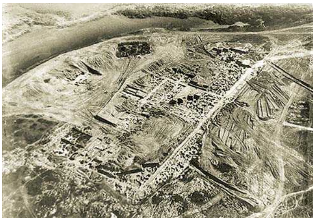
1930 жылы М.И. Артамоновтың «Саркел» (грекше Саркел, хазарша Шаркел) қаласын түсірген аэрофотосы

Хазар хандығының құлауына себепкер болған келесі жағдай IX ғасырдың екінші жартысында Еділден өтіп шабуылдай кірген печенегтер болатын. Хазарлардың күнкөріс көзі болған саудасаттық ісі тығырыққа тірелді. Ақыры X ғасырдың соңын ала хазарлардың туы жығылып күйреді. Қолда бар дерек көздерінде келтірілген мәліметтер тым аз болғандықтан Хазар теңізі (Каспий) деп қай жылдары аталғаны белгісіз. Бұл да сол хазар халқының даңқты атынан қалған жер-су атауларының бірі.