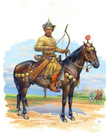
Хазар жауынгерінің бейнесі