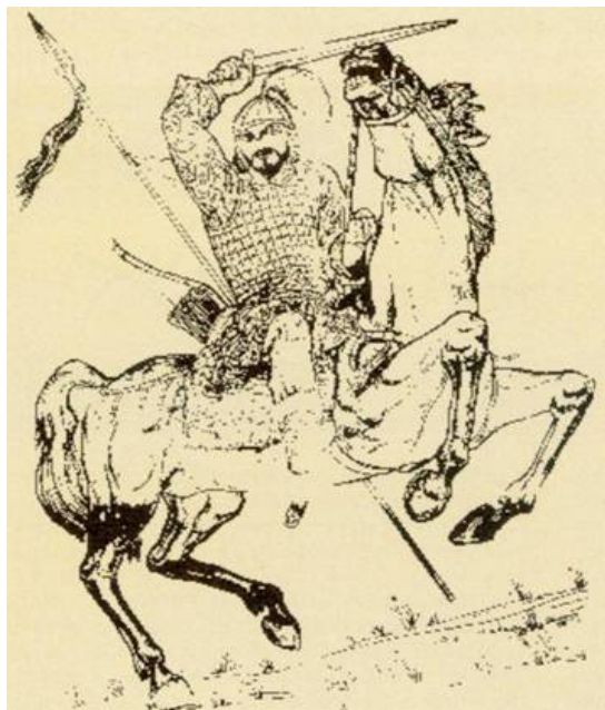
Хазар жауынгерінің бейнесі

Кавказда 642 жылы арабтармен бірінші шайқас өтті. Бірінші соғыс кезінде арабтардың әскербасы мерт болып, хазарлар жеңіске жетеді. Шайқас Баланжир деген жерде өтеді, бұл хазар ханының ордасы болатын. Кейінірек хазарлар ордасы орын ауыстырып Самандарға көшеді, содан кейін Еділ (Итель) бойына қоныстанады.