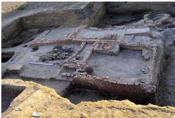
Итил немесе Еділ қаласының бір көрінісі

IX ғасырда Балтық теңізінен Қара теңізге дейінгі аймақ орыстар құрған мемлекет болды. Орыстар хазар хандығынан бірнеше рет соққы жеді. 910-915 жылдары Камадая Каспий теңізіне, Хазарға Святослав шапқыншыларын жіберген кезде оларды хазарлар жойып жібергені де тарихтан белгілі.