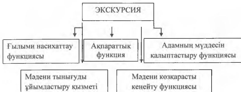
Сурет 1.1 - Экскурсияның маңызды функциялары

Экскурсияның негізгі функциялары мыналар болып табылады (1-сурет):