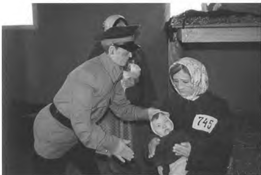
Сурет 1.2 - АЛЖИР мұражайынан көрініс

Үшінші аспект - экскурсия толықтай тарихи оқиғаларды, тарихи ескерткіштерді көрсетуге арналды. Бүгінгі күнмен байланыс, өткен оқиғалар ғылыми жетістіктің негізінде қазіргі заман тұрғысынан бағаланады. Комментарийлер мен тұжырымдамалар бүгінгі күннің басым көзқарасын ескереді. Мысалы, тоталитаризм құрбандарын еске алатын «Вечная память узницам АЛЖИР» экскурсиясына келесідей баға береді: «Алжир - Отанын сатқандар әйелдерінің Ақмола лагері - бұл деп тұтқын әйелдердің өздері атаған. Бұл лагерде «Отанын санқан жанұяның мүшесі» деген жеке іс-құжатына жазылған әйелдер мерзімін өтеген. Қылмыс жасамаса да олар Отанын сатты деп айыпталғандардың жұбайы, қызы, анасы, қарындасы болуына байланысты, арнаулы лагерлерде мерзімін өтеуге мәжбүр болды. Әйелдер жасамаған қылмыстары үшін абақтыға қамалды...»