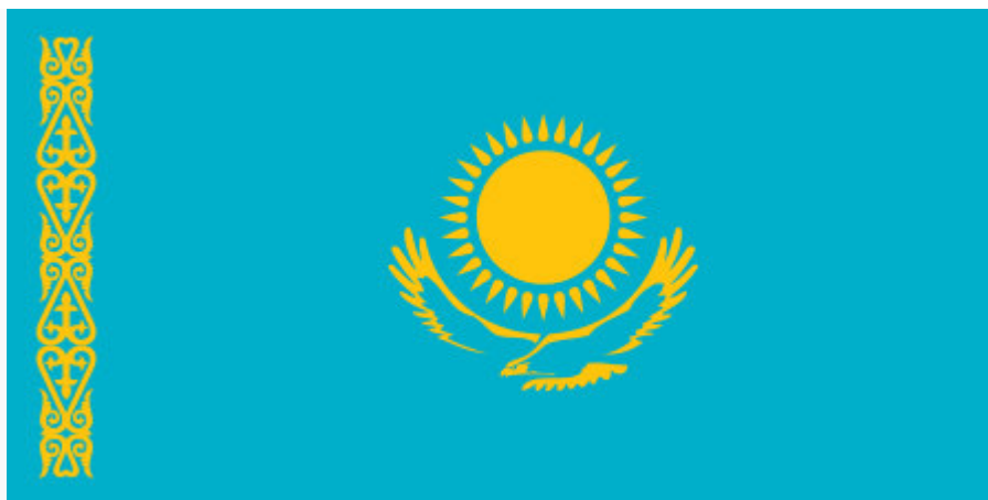
Флаг Республики Казахстан, 1992