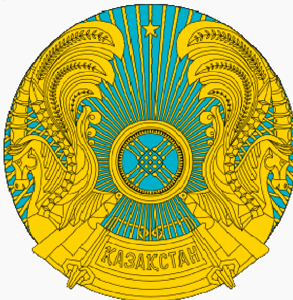
Герб Республики Казахстан, 1992