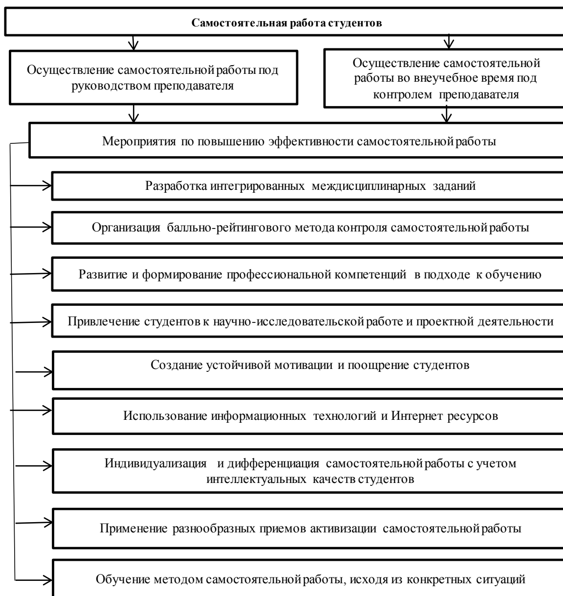
Рис. 3. Виды самостоятельной работы и мероприятия по повышению их эффективности

Также большое значение для совершенствования учебного процесса имеет: разработка интегрированных самостоятельных работ; модульно-рейтинговый контроль самостоятельной работы; ориентация лекционных курсов на самостоятельную работу; разработка нестандартных заданий; проведение занятий, предполагающих предварительную самостоятельную работу обучающихся по конкретной теме учебной дисциплины.